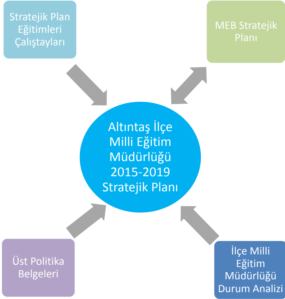
Şekil 1: Plan Oluşum Şekli